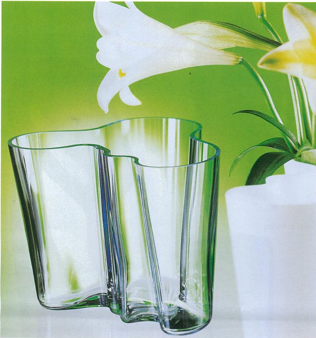
Vase - Alvar Aalto