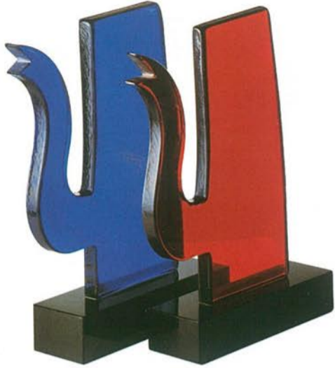
Cafetière - Klaas Gubbels